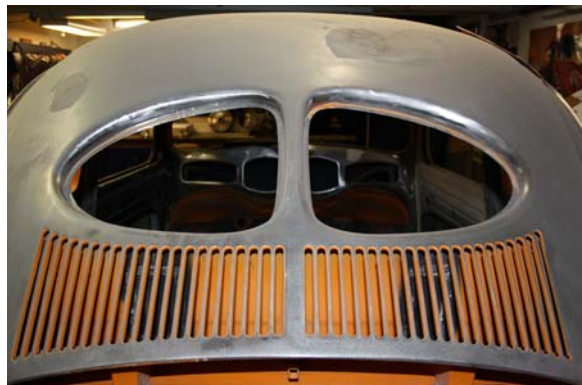
Det var lite trångt i garaget men det var fina bilar!